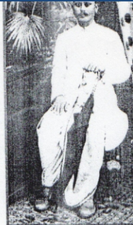
समग्र पश्चिम अंचल शिक्षा भारतीमां झूल-आडुने धेर-धेर शाशीतुं कर-नार साड शिवछ वाडछ.